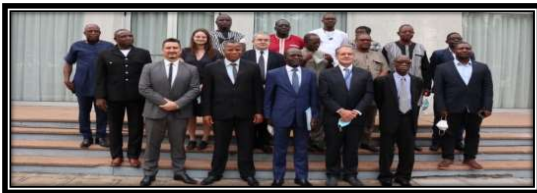
Photo de famille de la cérémonie officielle de lancement du SyRIMAO