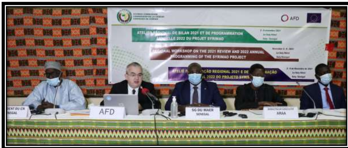
Atelier régional de bilan 2021 et de programmation 2022, tenu à Saly/Sénégal