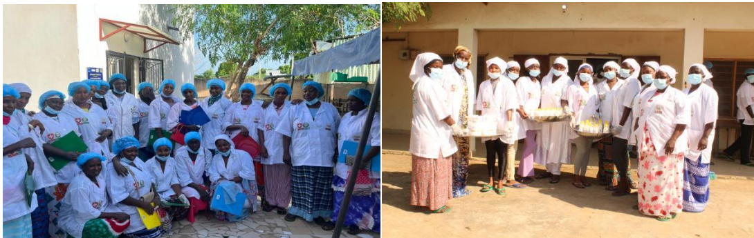
Figure 13. AFAO-WAWA : Formation des jeunes filles au Sénégal et en Gambie sur les techniques de production des produits laitiers

Au regard du niveau élevé d'intégration des besoins et intérêts spécifiques des jeunes femmes et des jeunes hommes d'une part et, de la contribution à la réduction des inégalités de genre, la prise en compte du genre dans la mise en œuvre du programme à mi-parcours est jugée très satisfaisante, avec un score de 4 sur 4 sur l'échelle de Likert.