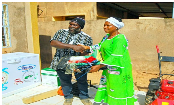
Figure 3. IPROLAIT - Dotation en équipement des bénéficiaires

L'évaluation à mi-parcours confirme la pertinence du programme : celui-ci était opportun au moment de son élaboration et reste toujours pertinent à ce jour. Le programme est approprié et adapté aux besoins des jeunes, des communautés ainsi que des partenaires locaux. La pertinence du programme, tant au niveau de la conception qu'à celui de la mise en œuvre, est jugée très satisfaisante avec une note de 4/4.