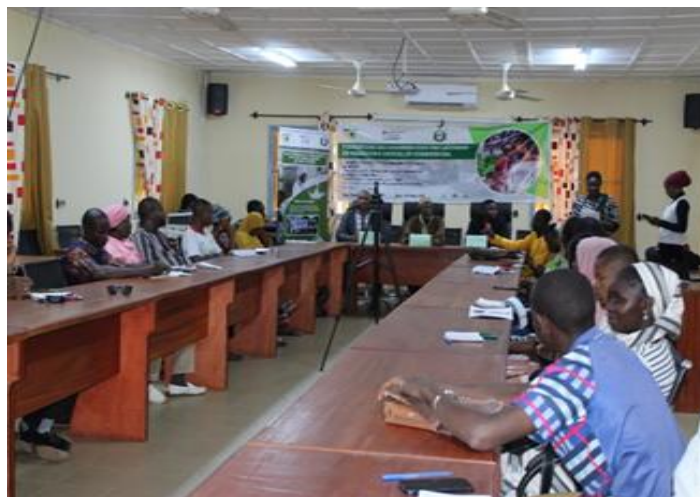
Figure 2. UMPLB - Formation de 20 jeunes en marketing digital

Les actions mises en œuvre à travers les 24 projets terrains dans 11 pays de la CEDEAO et le Tchad portent sur les formations en gestion, l'appui à l'équipement et le coaching technique et ont permis à plusieurs jeunes de créer ou renforcer des mini-entreprises dans la chaîne de valeur lait (Figures 2 et 3). Ces actions constituent des réponses pertinentes aux défis annoncés plus haut et méritent d'être renforcées.