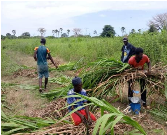
Figure 4. CNMDE - Jeunes récoltant du fourrage