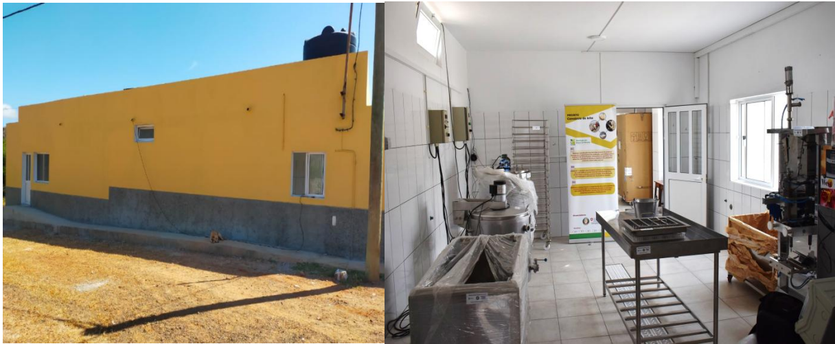
Figure 10. Unité centrale de transformation de lait réalisée par l'AAN au Cap Vert