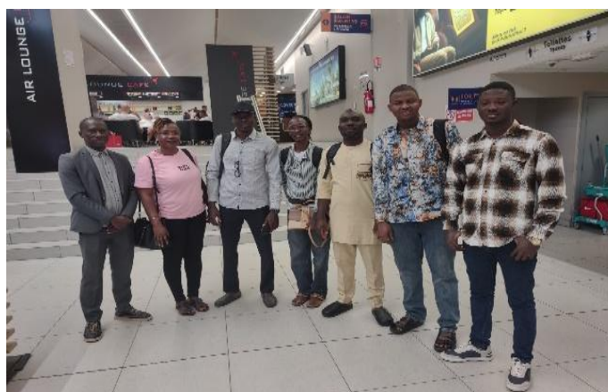
Figure 7. Vue de quelques stagiaires professionnels du PRAOP-3

Après 3 ans de mise en œuvre du PRAOP3, les résultats obtenus sur cette composante sont consignés dans le Tableau 2. Le taux d'exécution physique de cette composante est de 67%, ce qui traduit une bonne performance de mise en œuvre à mi-parcours. Toutefois, on observe une disparité dans la performance de mise en œuvre des projets de terrain. Celle-ci est globalement satisfaisante pour la plupart des projets de terrain, à l'exception des projets portés par CODIEXPERT, UMPLB, ROPPA, FERLAIT, AMEN et CICS qui ont enregistré un taux d' exécution physique inférieur à 50% (Annexe 5). Dès lors, un suivi-accompagnement rapproché de ces projets est nécessaire pour améliorer leur performance et garantir l'atteinte de leurs objectifs spécifiques d'ici leur date de clôture prévue pour décembre 2025.