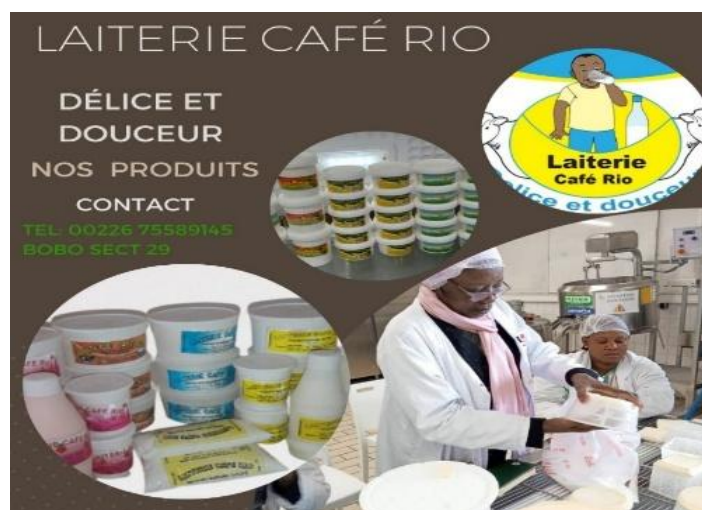
Figure 8. UMPLB - Promotion des produits laitiers d'une bénéficiaire à Bobo- Dioulasso, au Burkina Faso

Le soutien à l'organisation d'évènements régionaux/internationaux de capitalisation et de partage des expériences sur la promotion de la filière lait local s'est traduit par l'appui aux OPR et au management de la CEDAO pour leur participation à la réunion préparatoire et proprement dite de Nouakchott plus10. En termes d'objectif, Nouakchott +10 s'est appuyé sur des réalisations, des acquis, des gaps pour mobiliser des ressources en vue de financer des programmes majeurs : emploi des jeunes, production de fourrage/aliment bétail, commercialisation du bétail, etc. Au cours de cet atelier, les OPR ont plaidé pour la conception d'un programme régional ambitieux, couvrant les pays sahéliens et les pays côtiers, en phase avec les flux de transhumance et de commerce du bétail. Dans cette perspective plusieurs actions cruciales sont mises en avant par les participants. En lien avec les objectifs de développement du PRAOP3, les OPR ont vivement recommandé « un renforcement des chaînes de valeur des systèmes pastoraux et agro-pastoraux pour améliorer leur contribution à la création d'emplois décents et de revenus pour les jeunes (hommes et femmes) » mais surtout souhaité « la consolidation de la citoyenneté des éleveurs (pasteurs