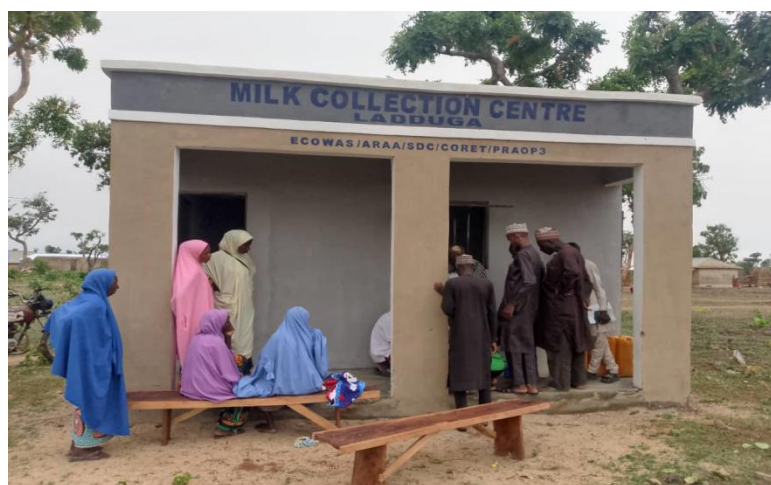
Figure 6. CORET - Centre de collecte de lait Ladduga au Nigéria