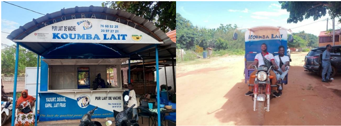
Figure 12. UMLPB : Modèle de circuit de distribution avec un modèle de « resto-lait » avec moyen de distribution à Bobo Dioulasso, Burkina Faso