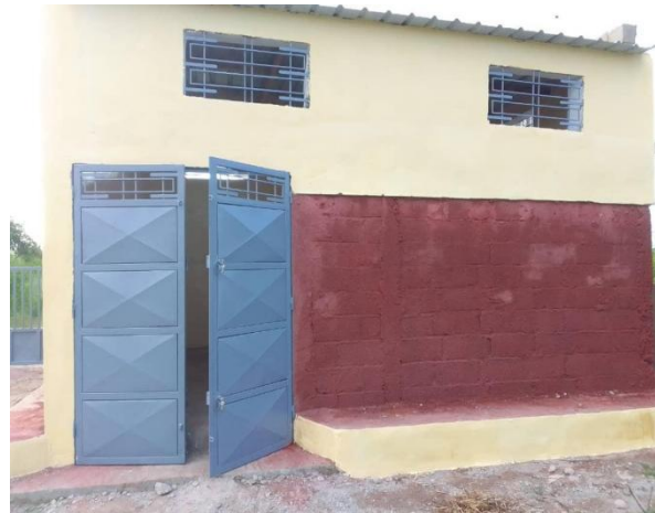
Figure 5. Magasin de stockage de fourrage