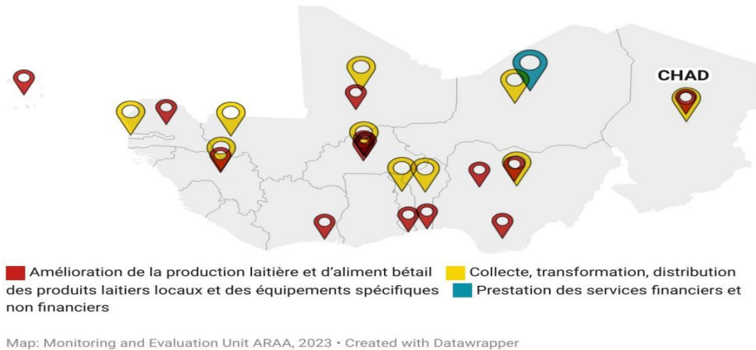
Figure 1. Carte de répartition géographique des sous-projets dans la zone d'intervention du PRAOP-3