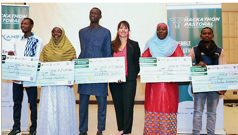
Figure 9. Remise des prix aux 5 jeunes dont les solutions numériques permettent d'améliorer l'attractivité des jeunes dans la filière lait local

Quant à la thématique 2 « Collecte, transformation, distribution des produits laitiers locaux et des équipements spécifiques », les jeunes filles formées par AFAO-WAWA sont immédiatement installées grâce à un système de micro-crédit (fond revolving). L'utilisation des solutions numériques promues par le programme dans le cadre du projet porté par le RBM contribuera de manière significative à renforcer l'attractivité des jeunes vers les métiers de la filière lait local (Figure 9).