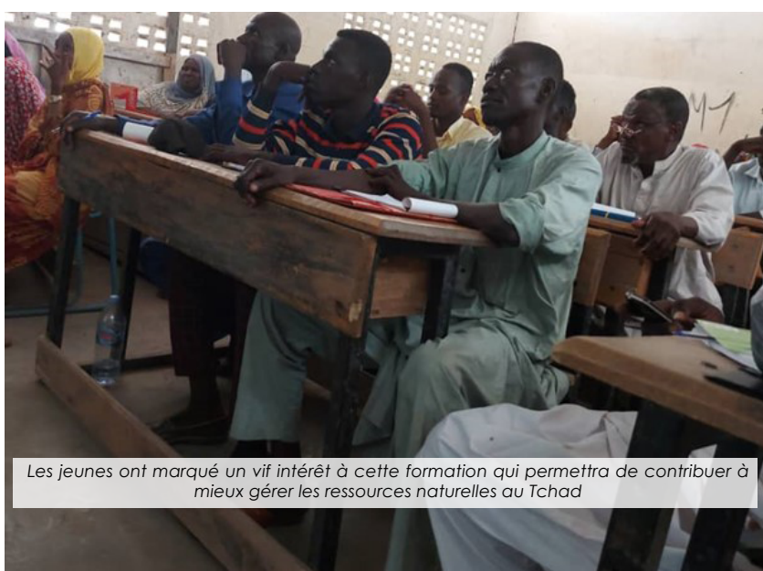
Les jeunes ont marqué un vif intérêt à cette formation qui permettra de contribuer à mieux gérer les ressources naturelles au Tchad

50 jeunes Agriculteurs (trices) y compris les femmes bénéficiaires du PRSA dans les provinces du Logone oriental, du Logone occidental, du Mayo-kebbi Ouest ont été formés du 26 au 27 juin 2024 sur la prévention et la gestion de la pollution et l'utilisation rationnelle et durable des ressources naturelles. Les formations ont été axées sur l'utilisation rationnelle des ressources naturelles et sur prévention et gestion de la pollution. Lire plus