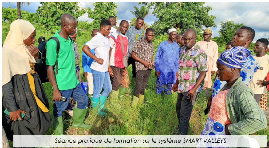
Séance pratique de formation sur le système SMART VALLEYS

Au Togo comme dans plusieurs pays de l'Afrique de l'Ouest, les aménagements des terres agricoles, surtout les bas-fonds nécessitent des ressources humaines et financières assez coûteuses pour les exploitants agricoles. Ces derniers sont souvent confrontés ... Lire plus