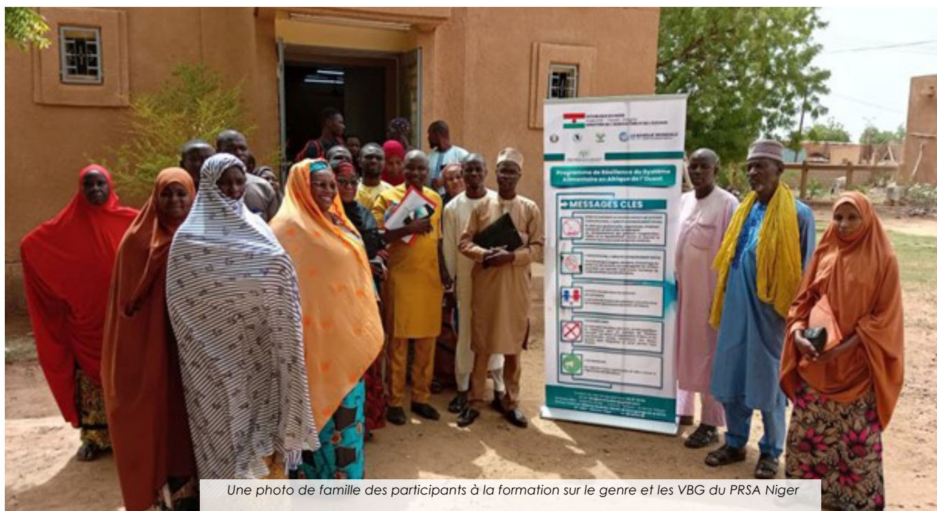
Une photo de famille des participants à la formation sur le genre et les VBG du PRSA Niger

L'équipe de coordination du programme de résilience du système alimentaire e Afrique de l'Ouest (PRSA) Niger a organisé du 24 au 25 juin 2024 un atelier de formation sur les violences basées sur le genre à l'endroit des membres des comités de gestion des plaintes des 5 communes d'intervention de la région de Tillabéry... Lire plus