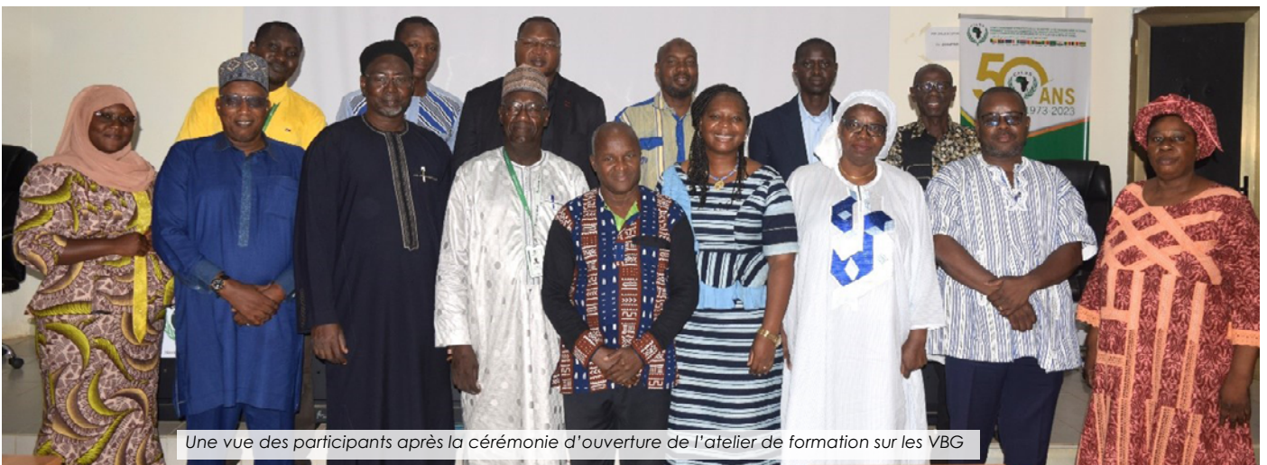
Une vue des participants après la cérémonie d'ouverture de l'atelier de formation sur les VBG

Dans le cadre de la mise en œuvre de la composante 1 du Programme de Résilience du Système Alimentaire en Afrique de l'Ouest (FSRP), il a été organisé, du 24 au 26 juin 2024 à Niamey (Niger), un atelier de renforcement de capacités du personnel d'AGRHYMET CCR-AOS... Lire plus