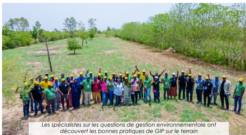
Les spécialistes sur les questions de gestion environnementale ont découvert les bonnes pratiques de GIP sur le terrain

En vue de renforcer la résilience des producteurs face aux aléas climatiques et à la dégradation des terres, le CORAF vient de réaliser une cartographie des bonnes pratiques de Gestion Intégrée du Paysage (GIP) en Afrique de l'Ouest et du Centre