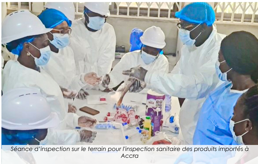
Séance d'inspection sur le terrain pour l'inspection sanitaire des produits importés à Accra

La CEDEAO a formé une centaine de praticiens et de régulateurs ghanéens et burkinabés impliqués dans le commerce alimentaire et agricole, sur les mesures sanitaires et phytosanitaires (SPS), afin d'assurer la sécurité alimentaire dans la sous-région... Lire plus