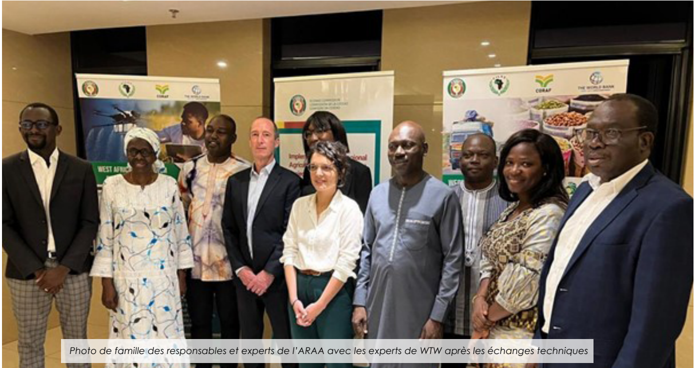
Photo de famille des responsables et experts de l'ARAA avec les experts de WTW après les échanges techniques

Dans le cadre de l'appui de la Banque mondiale au renforcement de la Réserve régionale de sécurité alimentaire (RRSA) de la CEDEAO à travers la composante GRIF du FSRP, une visite du cabinet WILLIS TOWERS WATSON aux EXPERTS de l'ARAA/CEDEAO... Lire plus