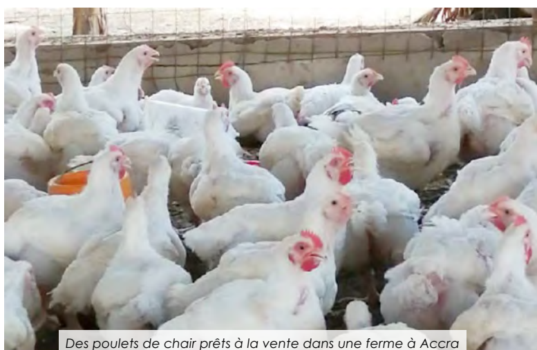
Des poulets de chair prêts à la vente dans une ferme à Accra

Dans le cadre de la mise en œuvre du Programme de résilience du système alimentaire de l'Afrique de l'Ouest (FSRP) au Ghana, des échanges ont été engagés avec les acteurs et industriels de la filière avicole afin de mettre en place un programme d'intensification de l'aviculture dans le pays. Ce programme vise à produire au moins 2 millions de poulets de chair d'ici... Lire plus