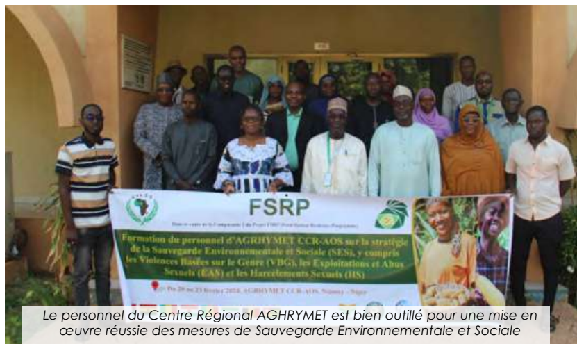
Le personnel du Centre Régional AGRHYMET est bien outillé pour une mise en œuvre réussie des mesures de Sauvegarde Environnementale et Sociale

Du 20 au 23 février 2024, une vingtaine de membres du personnel du Centre Régional AGRHYMET a eu une meilleure compréhension de la prise en compte des notions de sauvegardes environnementales et sociales incluant les violences basées sur le Genre (VBG), l'exploitation et Abus Sexuel (EAS) et .... Lire plus