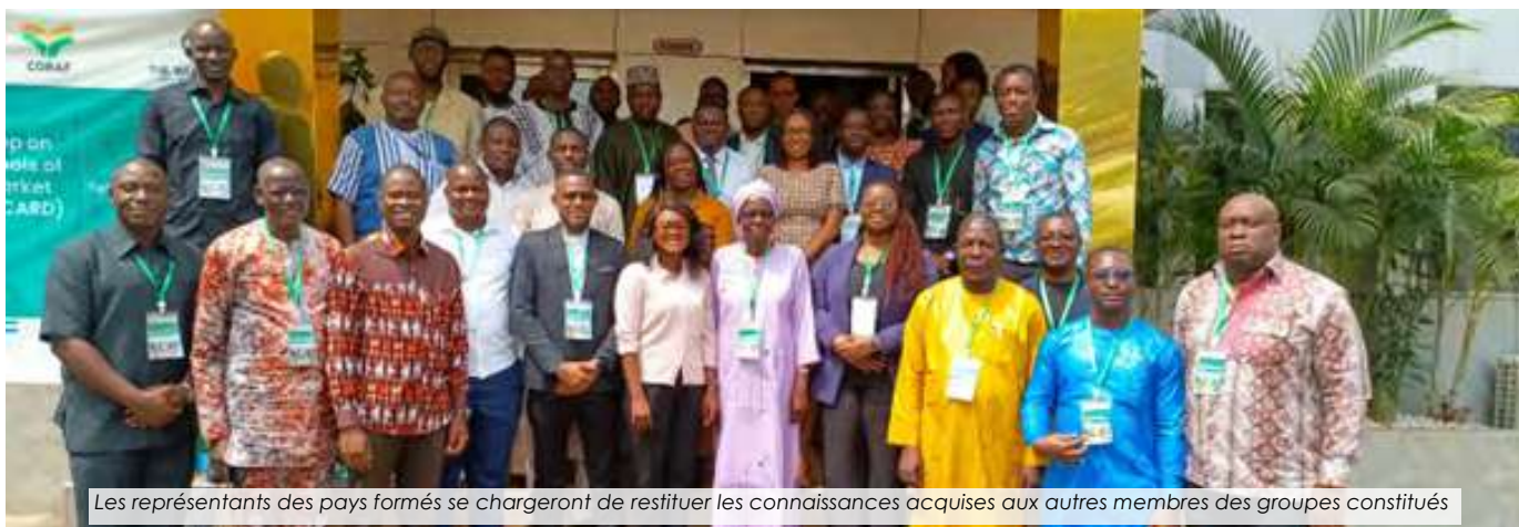
Les représentants des pays formés se chargeront de restituer les connaissances acquises aux autres membres des groupes constitués

23 acteurs et partenaires spécialisés sur les questions du commerce et des marchés agricoles en Afrique de l'Ouest et du Tchad ont désormais une meilleure compréhension du Tableau de bord du Commerce et du Marché agricole de la CEDEAO (EATM-SCORECARD). Ces acteurs venus du Burkina Faso, du Ghana, du Mali, du Niger, de la Sierra Leone, du Tchad et du Togo et des structures partenaires... Lire plus