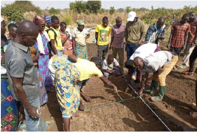
Une séance de formation des producteurs au semis dans la région des Savanes du Togo

L'année 2023 a été pour les pays de la phase 1 du FSRP (Burkina Faso, Mali, Niger et Togo), la deuxième année de mise en œuvre du programme. Des réalisations majeures sont à mettre à l'actif de ces pays. Nous vous proposons quelques réalisations clés du Niger et du