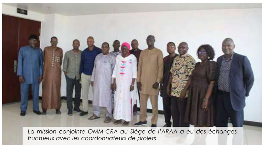
La mission conjointe OMM-CRA au Siège de l'ARAA a eu des échanges fructueux avec les coordonnateurs de projets

Érigé en juillet 2020 en Centre Climatique régional pour l'Afrique de l'Ouest et le Sahel (CCR-AOS) par la Commission de la CEDEAO, le Centre Régional AGRHYMET (CRA) assure désormais le suivi climatique régional basé sur les données ... Lire plus