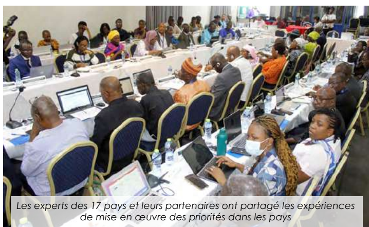
Les experts des 17 pays et leurs partenaires ont partagé les expériences de mise en œuvre des priorités dans les pays

Plus de quatre-vingt-cinq experts des questions de sécurité sanitaire des aliments issus de dix-sept pays en Afrique de l'Ouest et au Sahel et leurs partenaires se sont retrouvés à Accra du 26 au 28 février 2024 pour faire l'état des lieux de la sécurité sanitaire des aliments dans la sous-région... Lire plus