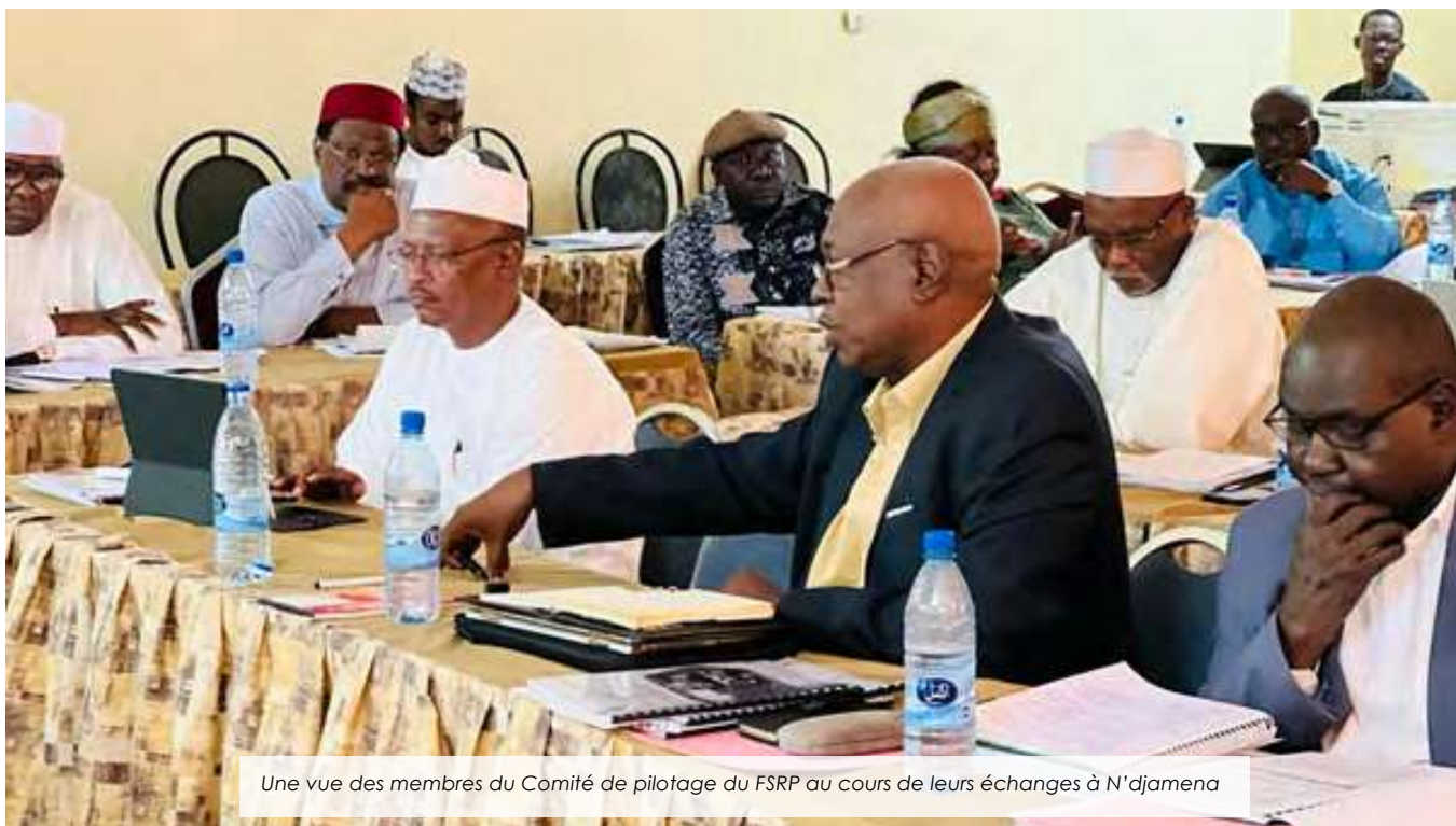
Une vue des membres du Comité de pilotage du FSRP au cours de leurs échanges à N'djamena