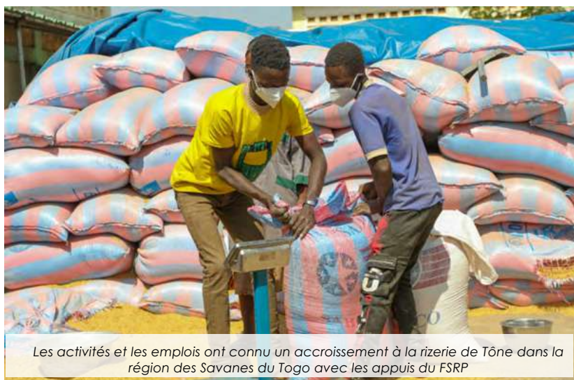
Les activités et les emplois ont connu un accroissement à la rizerie de Tône dans la région des Savanes du Togo avec les appuis du FSRP