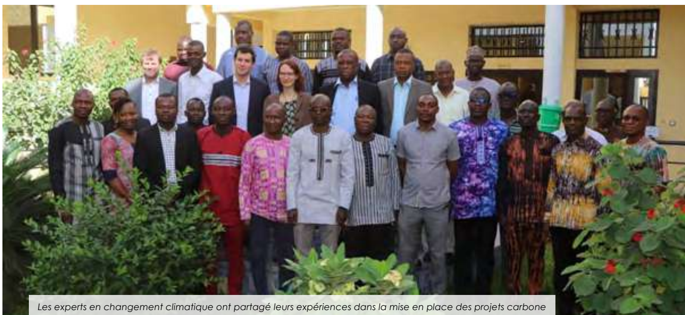
Les experts en changement climatique ont partagé leurs expériences dans la mise en place des projets carbone

Acteurs et partenaires du système alimentaire au Burkina Faso se sont retrouvés pour échanger sur les principales activités et les actions prioritaires en vue de mettre en place des mécanismes innovants pour l'adaptation au changement climatique... Lire plus